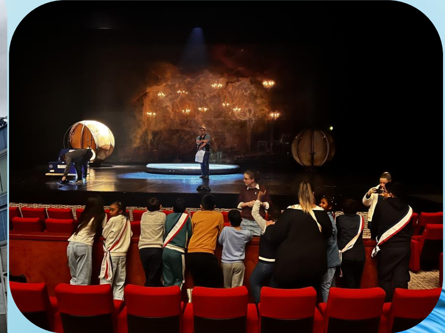
Décembre 2024 Opéra de Massy avec la Maison de l'Environnement ADP Paris-Orly Le CME a invité des enfants membres de l'association Parentaise Enfantine