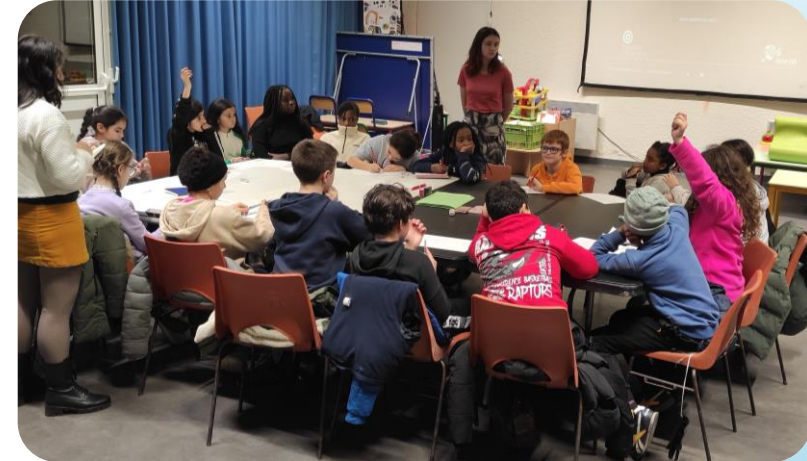
Finalistes en stage de préparation De janvier à mai (éditions 2024 et 2025)