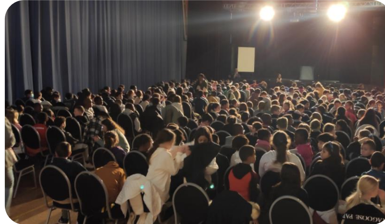
Novembre 2024 et 2025 – Lancement du Défi avec le spectacle « Mission Éloquence » pour les CM2