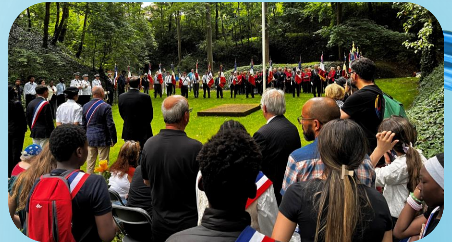
La clairière du souvenir