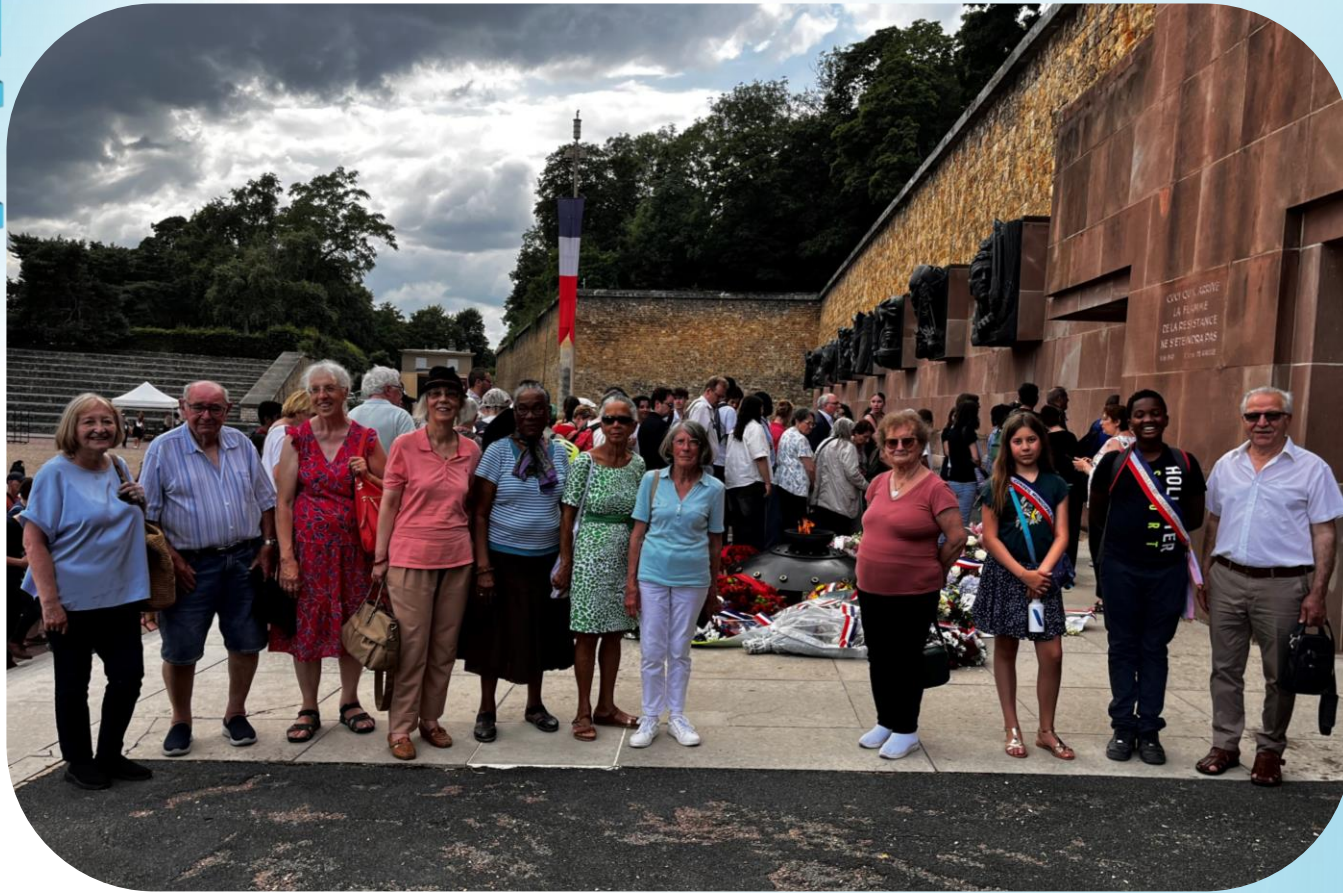
La flamme du Mont Valérien, sœur jumelle de celle située sous l'Arc de Triomphe

Avec l'Association Républicaine des Anciens Combattants (ARAC)