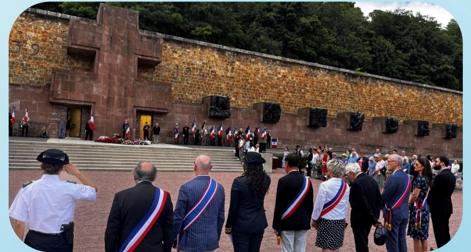
Face à La Croix de Lorraine