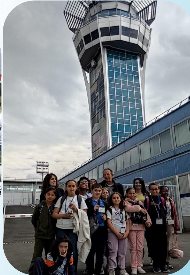
Juin 2024 Aéroport Paris-Orly avec la Maison de l'Environnement ADP Paris-Orly