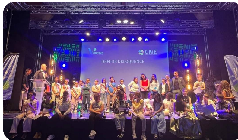
Juin 2024 – Finale du Défi de l'éloquence