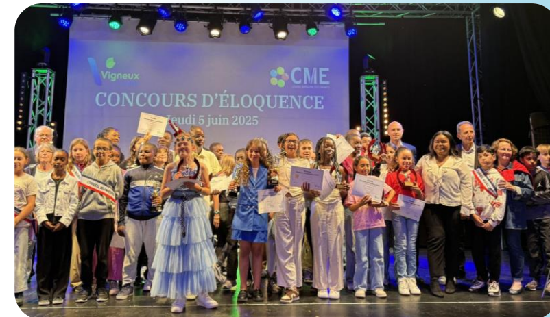
Juin 2025 – Finale du Défi de l'éloquence