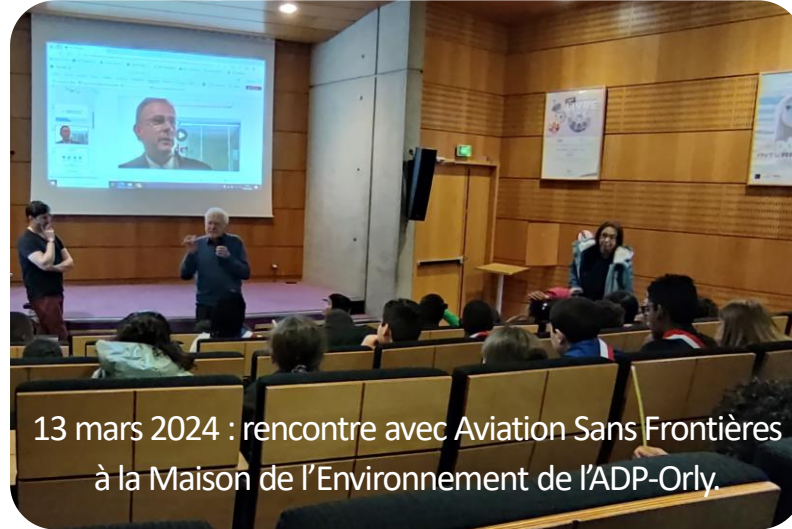
13 mars 2024 : rencontre avec Aviation Sans Frontières à la Maison de l'Environnement de l'ADP-Orly.

9 écoles élémentaires 7 services municipaux 2 associations locales Bibliothèque C. DELBO