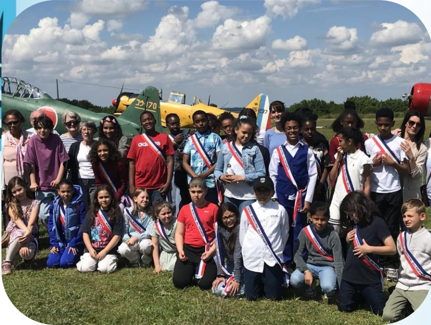
Mai 2024 Musée de l'Aviation à Cerny Avec l'Association Républicaine des Anciens Combattants et Victimes de Guerre (ARAC)