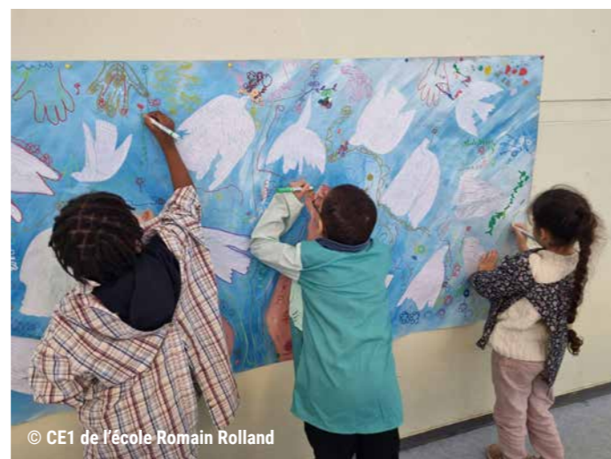
© CE1 de l'école Romain Rolland